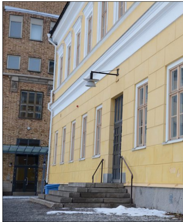
SPRÅKLÅDAN. Förvaltningsbyggnaden kallad Språklådan på Hermelinskolans gård är ett av de drabbade husen i Gymnasiebyn i Luleå.